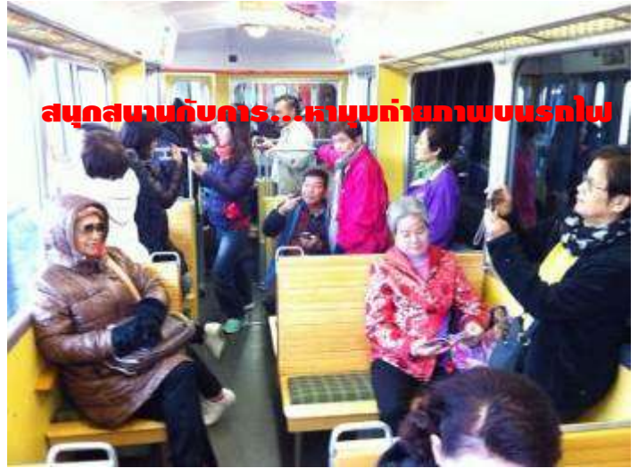
สนุกสนานกับคาร...หาหมอบถ่ายภาพบนรถไป

อยากสนุกสนาน และประทับใจกันแบบนี้... มาเที่ยวกับเรา: ครีบริบรองไม่ผิดหวัง