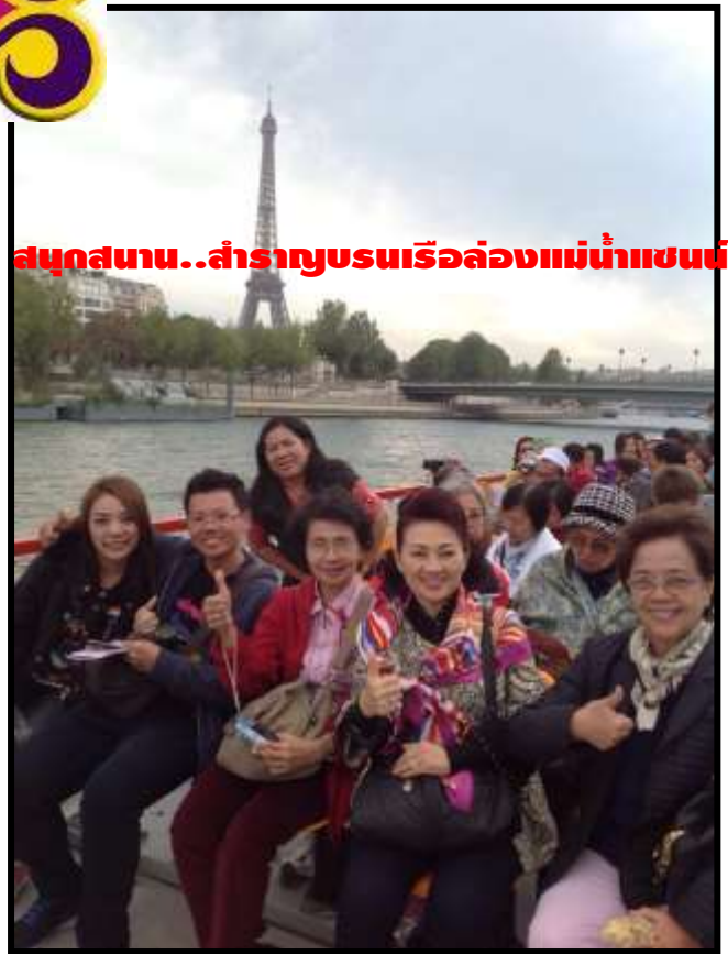
สนุกสนาน..สำราญชมเรือล่องแม่น้ำแซน

เรากำลังรอรับเกียรติจากทางท่าน...มาใช้บริการทัวร์ที่ดีจากทางเรา