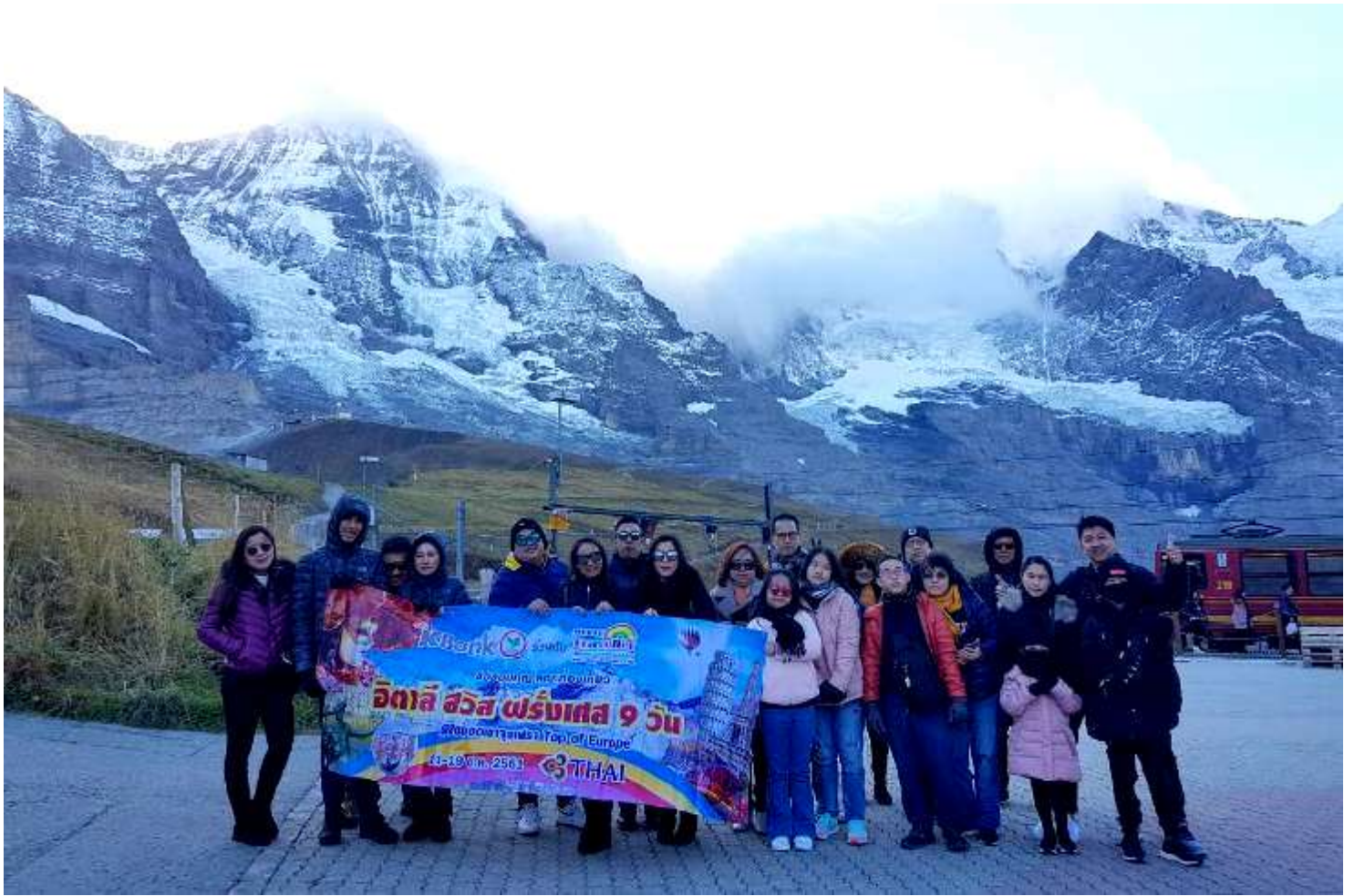
อิตาลี-สวิสเซอร์แลนด์-ฝรั่งเศส 9วัน TG PROMOTION4 เดินทางวันที่ 06-14 ต.ค.2561(จำนวน20ท่าน)