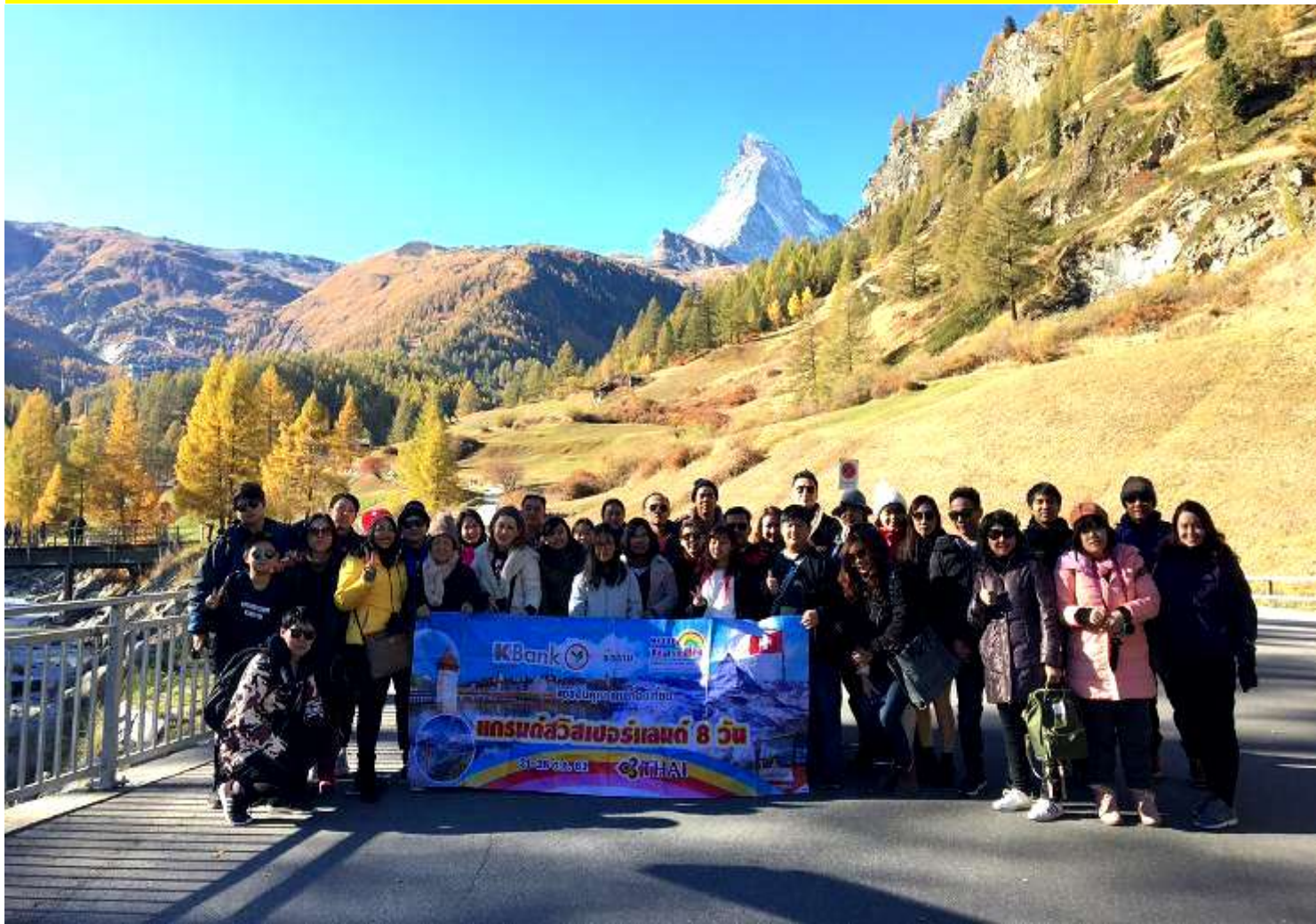
อิตาลี-สวิสเซอร์แลนด์-ฝรั่งเศส 9 วัน TG PROMOTION 4 ช่วงหยุดปี: 20-28 ต.ค. 2561 (จำนวน 40 ท่าน)