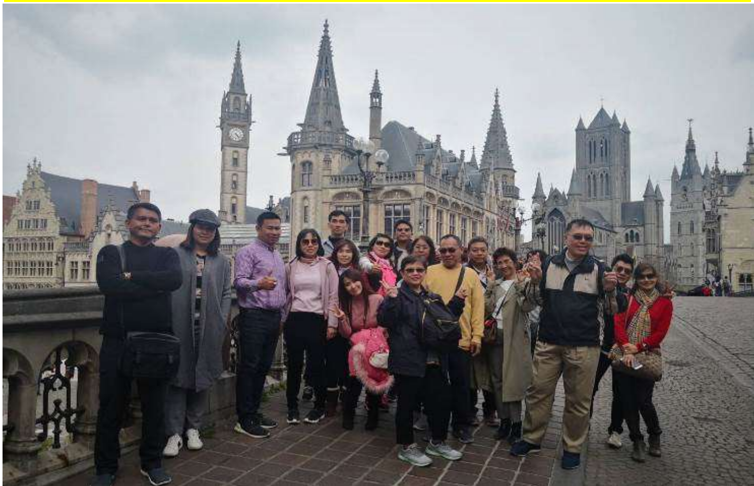
ยุโรปคอนฮอฟ(งานดอกไม้โลก)เยอรมัน เนเธอร์แลนด์ เบลเยียม สภทราด10-17เม.ย.2562 (จำนวน33ท่าน)