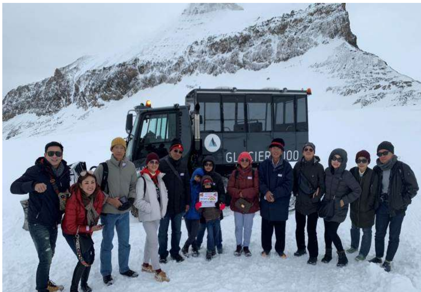
อิตาลี-สวิสเซอร์แลนด์-ฝรั่งเศส 9วัน TG SPECIAL3 วันที่ 16-24พ.ย.2562 (จำนวน26ท่าน)