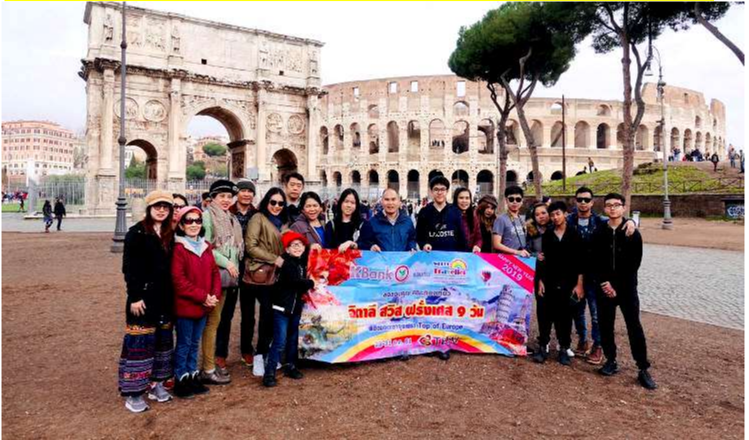
อิตาลี-สวิสเซอร์แลนด์-ฝรั่งเศส 10วัน TG DELUXE เดินทางปีใหม่ 22-31ธ.ค.2561(จำนวน20ท่าน)