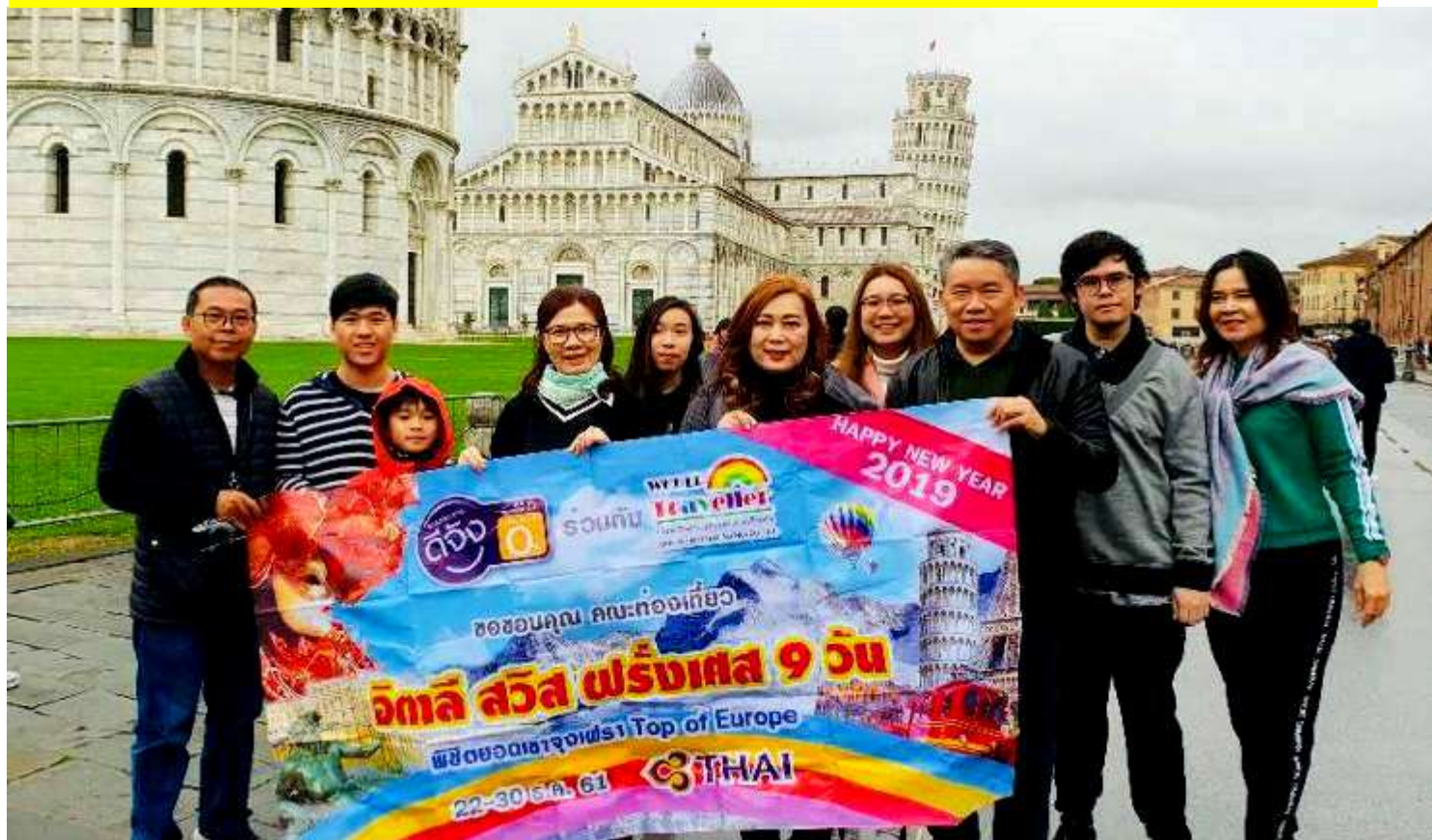
อิตาลี-สวิสเซอร์แลนด์-ฝรั่งเศส 9วัน TG PROMOTION4 เดินทาง 15-23 ธ.ค.2561(จำนวน32ท่าน)