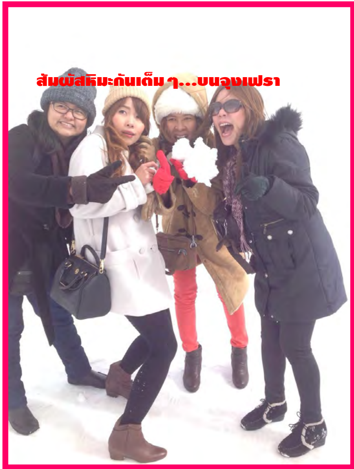
สัมผัสหิมะกันเต็ม ๆ...บนจุงเฟรา