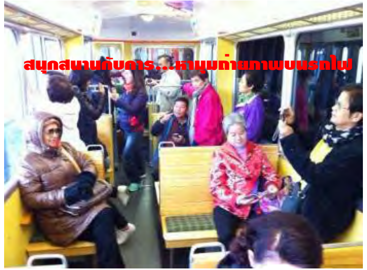
สนุกสนานกับคาร...หาหุ่นถ่ายภาพบนรถไป

อยากสนุกสนาน และประทับใจกันแบบนี้... มาเที่ยวกับเรา: ครีบริบรองไม่ผิดหวัง