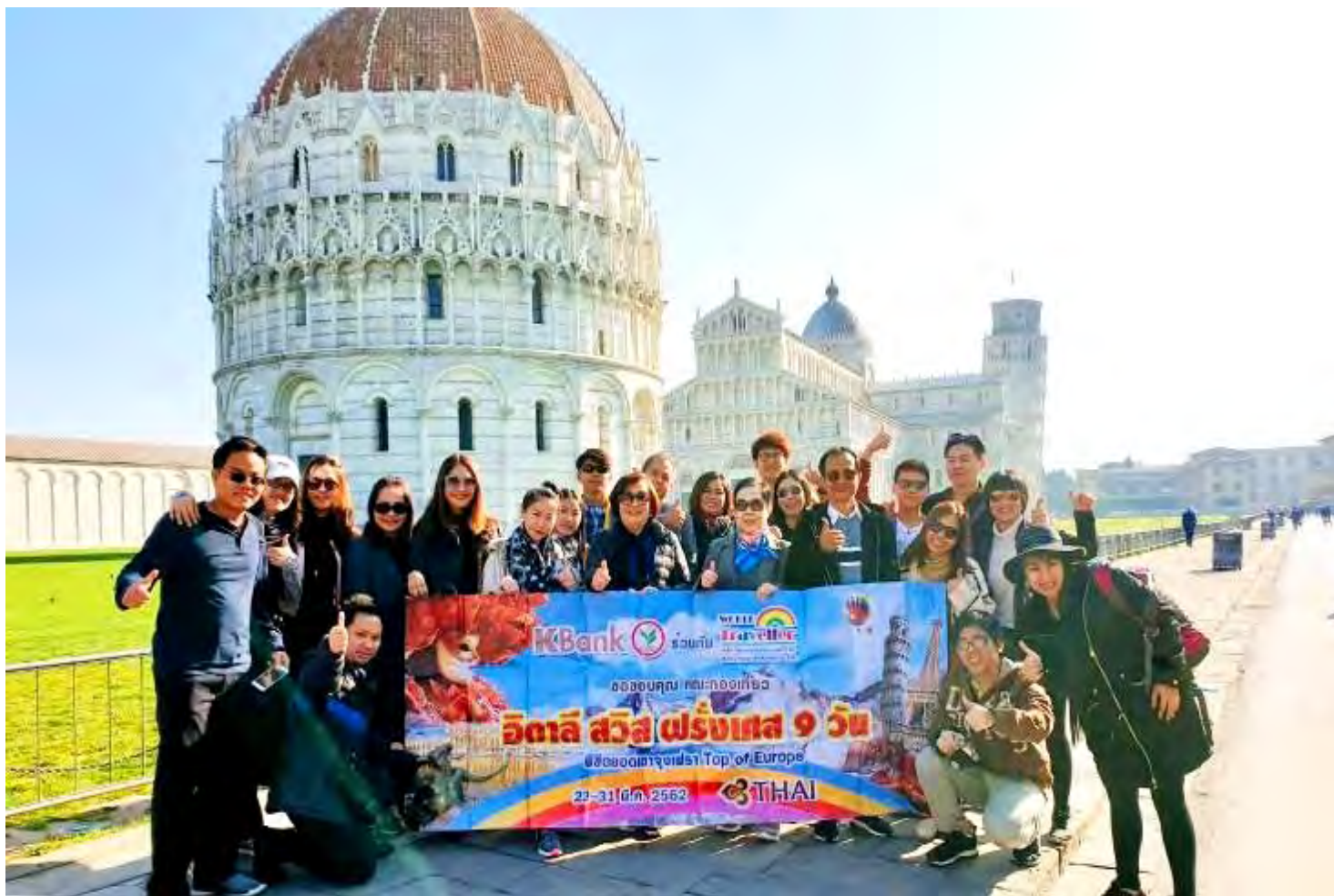
อิตาลี-สวิตเซอร์แลนด์-ฝรั่งเศส 9วัน TG PROMOTION4 วันที่23-31มี.ค.2562 (จำนวน24ท่าน) BUS2