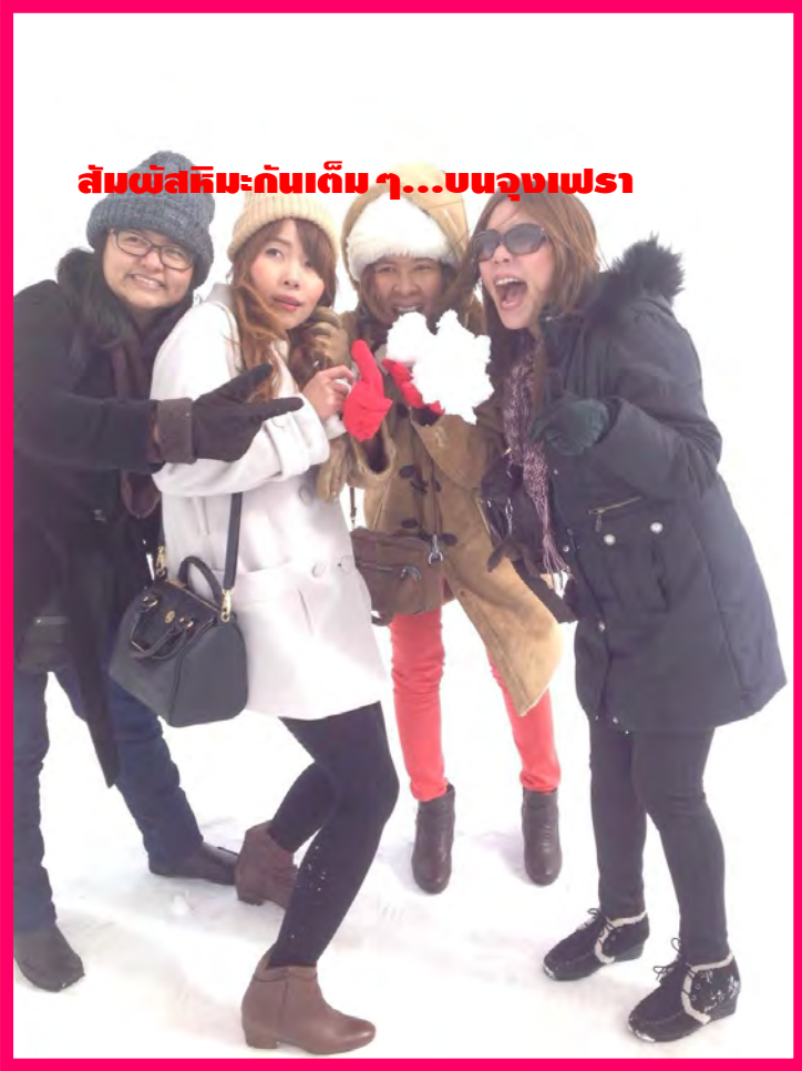
สัมผัสหิมะกันเต็ม ๆ...บน Jungfrau