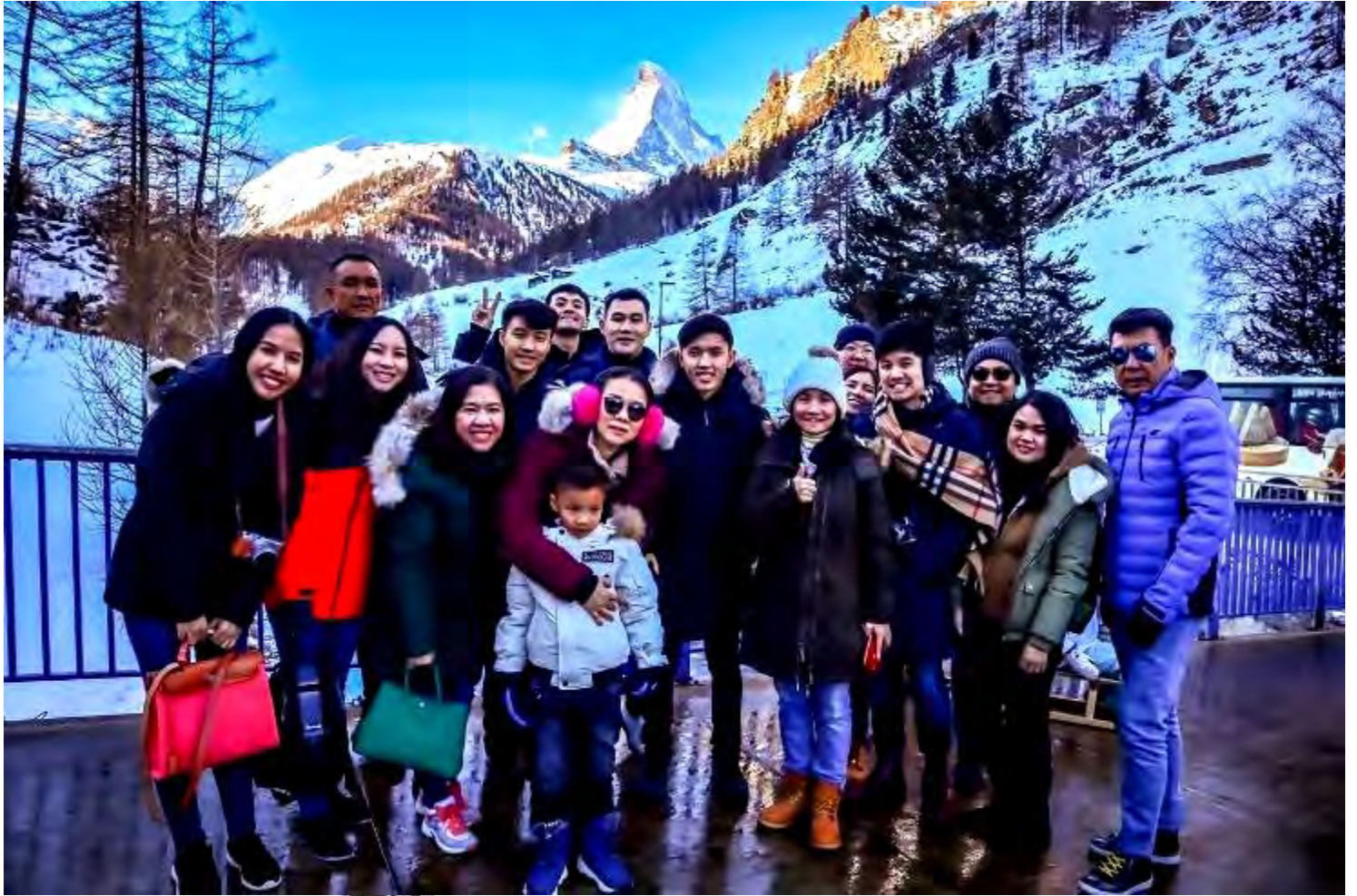
ยุโรปตะวันออก 9วัน TG DELUXE แพคเกจ Hallstatt เดินทางปีใหม่ 29ธ.ค.-06ม.ค.2562(จำนวน28ท่าน)