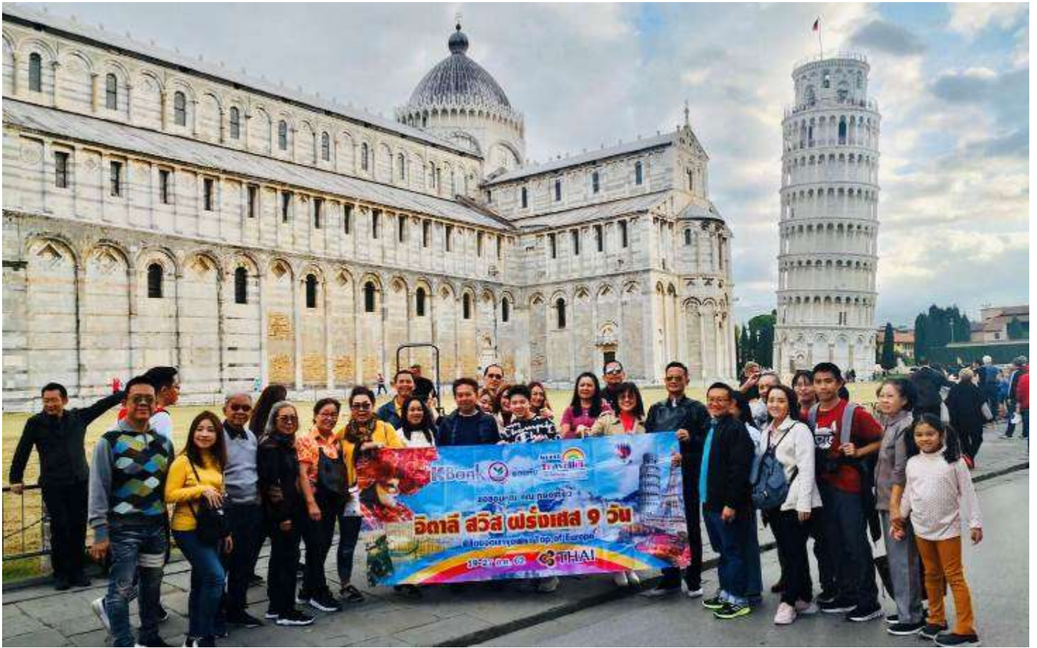
แครงด์สวิสเซอร์แลนด์8วัน TG PROMOTION2 วันที่ 13-20 ต.ค.2562 (จำนวน42ท่าน)