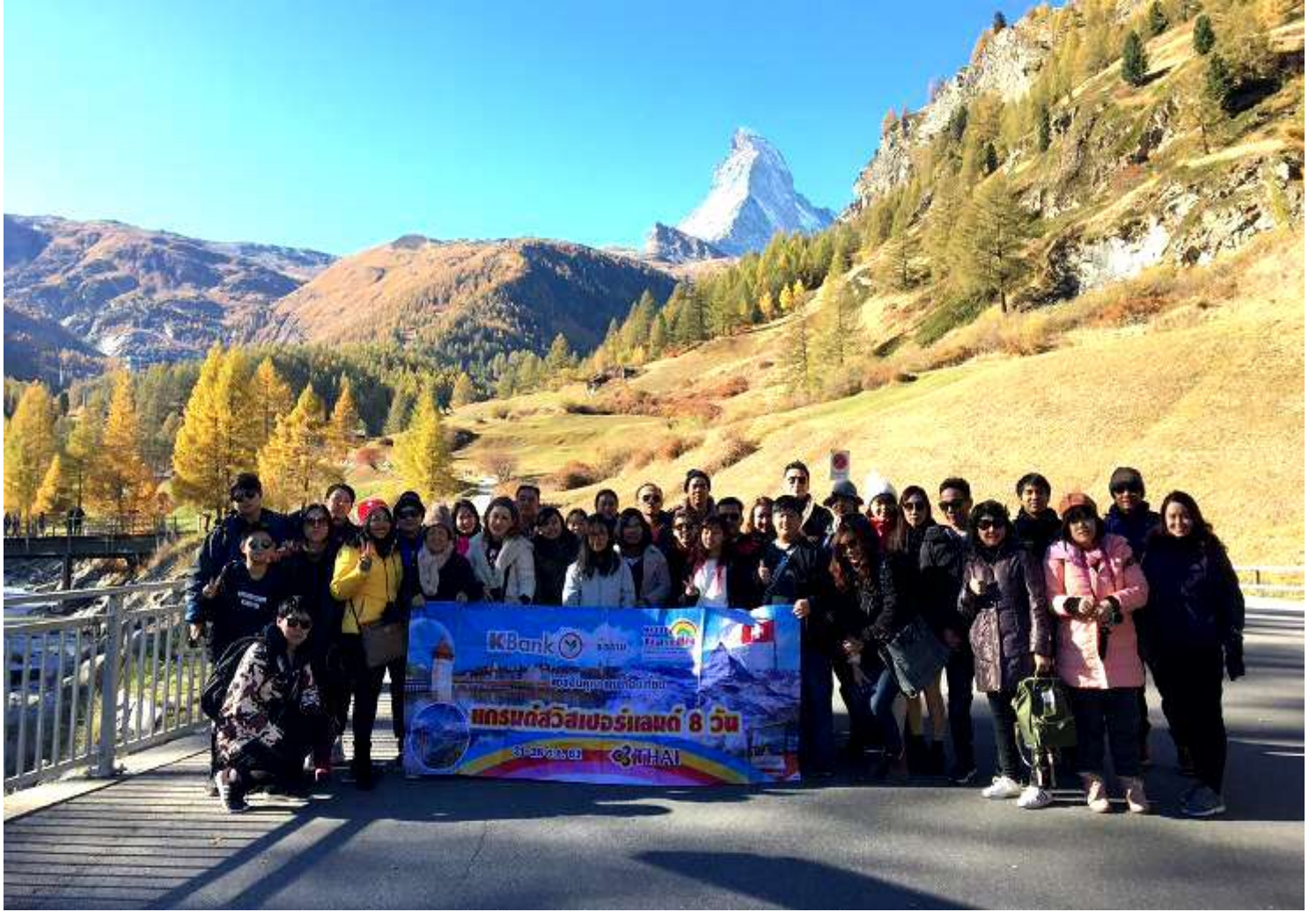
อิตาลี-สวิสเซอร์แลนด์-ฝรั่งเศส 9 วัน TG PROMOTION 4 ช่วงหยุดปี: 20-28 ต.ค. 2561 (จำนวน 40 ท่าน)