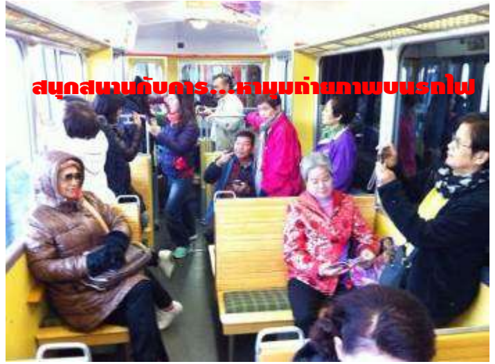
สนุกสนานกับคาร...หาหุ่นถ่ายภาพบนรถไป

อยากสนุกสนาน และประทับใจกันแบบนี้... มาเที่ยวกับเรา: ครีบรับรองไม่ผิดหวัง