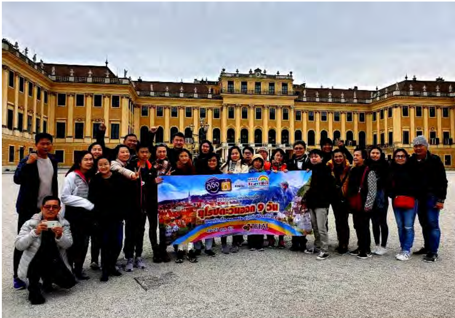
แรมเนสส์อัลไพน์แลนด์ 10 วัน TG DELUXE C พักริม ทะนดี เดินทางวันที่ 14-23 ต.ค.2561 (จำนวน22ท่าน)