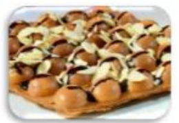
วาฟเฟิลฮ่องกง