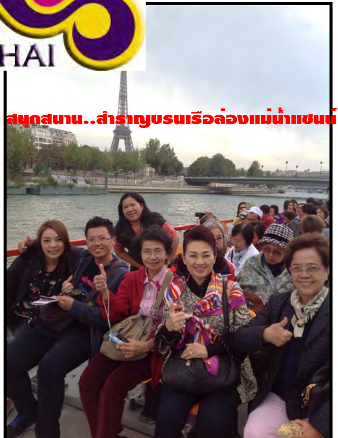
สนุกสนาน..สำราญชมเรือล่องแม่น้ำแซน

เรากำลังรอรับเกียรติจากทางท่าน...มาใช้บริการทัวร์ที่ดีจากทางเรา