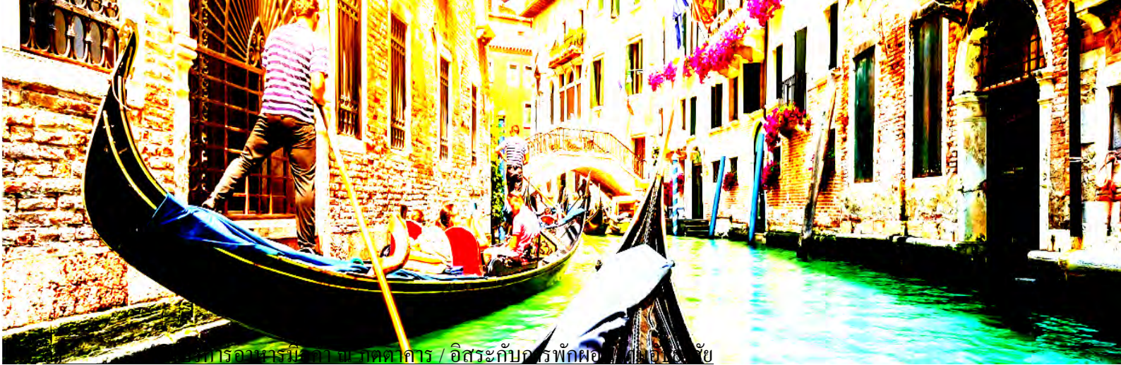
บริการอาหารมี ๒ มื้อ ภัตตาคาร / อิสระกับคอร์สพักผ่อน / ๒ ไร่ ๑๕ ไร่

พักที่ : HOLIDAY INN HOTEL/NOVOTEL HOTEL/★★★★ ***พักเมสตร์ 2 คืนติดสบาย ๆ***