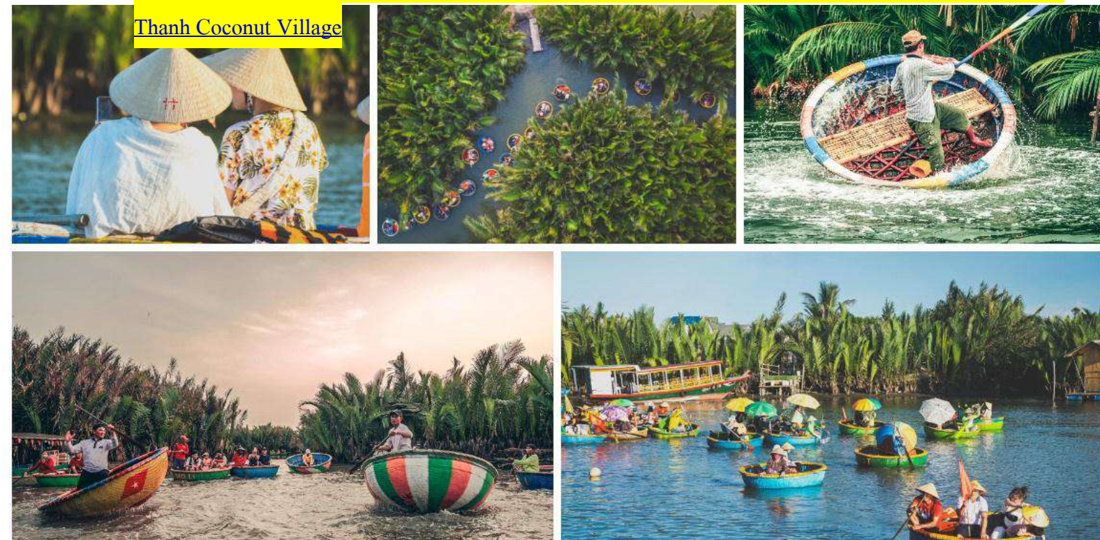
Thanh Coconut Village

จากนั้นนำท่านเดินทางสู่ หมู่บ้านแกะสลักหินอ่อนเป็นหมู่บ้านที่มีอาชีพแกะสลักหินอ่อนมานานกว่า 300 ปี ซึ่งหินที่ใช้แกะสลักนำมาจากเขาที่อยู่ในบริเวณใกล้เคียงหมู่บ้าน ปัจจุบันเหลือน้อยและต้องนำมาจากแหล่งอื่นๆ เพราะช่างแกะสลักที่มีความชำนาญนั้นต้องช่างจากหมู่บ้านนี้เท่านั้นซึ่งมีชื่อเสียงโด่งดังไปทั่วโลกในงานฝีมือการแกะสลักหินอ่อน และนำท่านออกเดินทางสู่ หมู่บ้านกัมทาน สัมผัสกับประสบการณ์ใหม่ในหมู่บ้านเล็กๆ ที่ตั้งอยู่ในเมืองฮอยอัน ภายในจะเป็นสวนมะพร้าวและมีแม่น้ำล้อมรอบ ในช่วงสมัยสงครามนั้นจะเป็นที่พักของ เหล่าทหารในปัจจุบันอาชีพหลักของคนที่นี่จะประกอบอาชีพทำประมงเป็นหลัก นำท่านสนุกสนานเพลิดเพลินกับการ ล่องเรือ กระดิ่ง ท่านจะได้รับชมวัฒนธรรมอันสวยงามของชาวท้องถิ่น และระหว่างที่ล่องเรือกระดิ่งอยู่นั้น ชาวบ้านที่นี่ก็จะมีการขับร้องเพลงพื้นเมือง และนำไม้พายเรือมาเคาะเพื่อประกอบเป็นจังหวะดนตรี พร้อมการแสดงบนแม่น้ำที่ Cam Thanh Village หรือ Cam