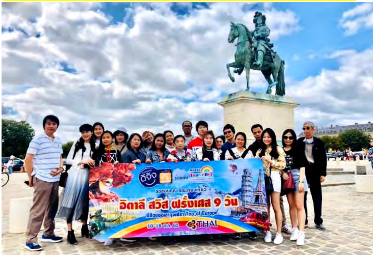
อิตาลี-สวิสเซอร์แลนด์-ฝรั่งเศส 9วัน TG PROMOTION4 วันที่ 13-21ก.ค.2562 (จำนวน26ท่าน)