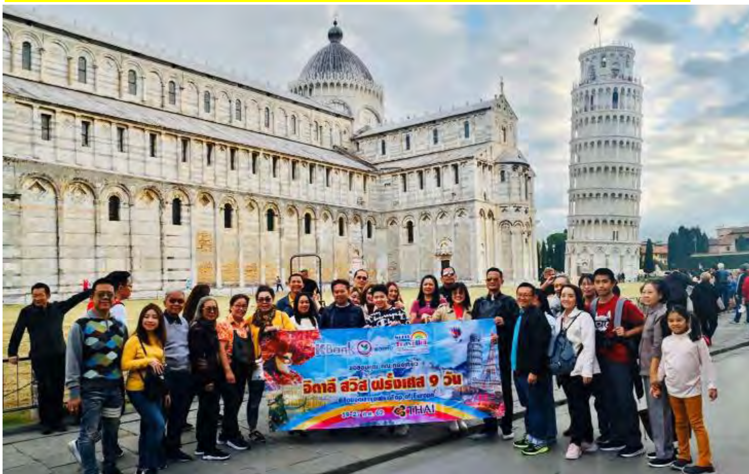
แครงด์สวิสเซอร์แลนด์8วัน TG PROMOTION2 วันที่ 13-20 ต.ค.2562 (จำนวน42ท่าน)