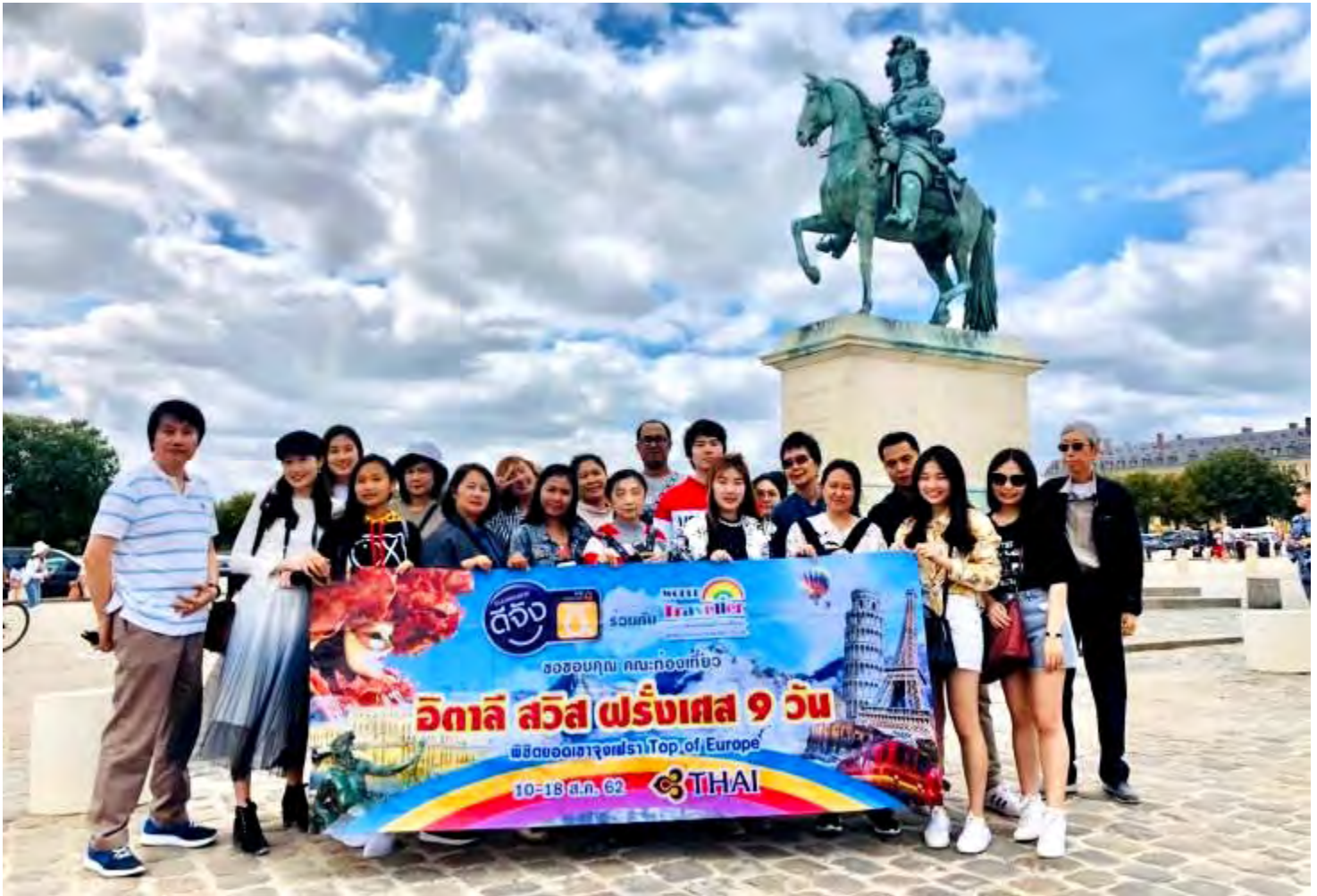
อิตาลี-สวิสเซอร์แลนด์-ฝรั่งเศส 9วัน TG PROMOTION4 วันที่ 13-21ก.ค.2562 (จำนวน26ท่าน)