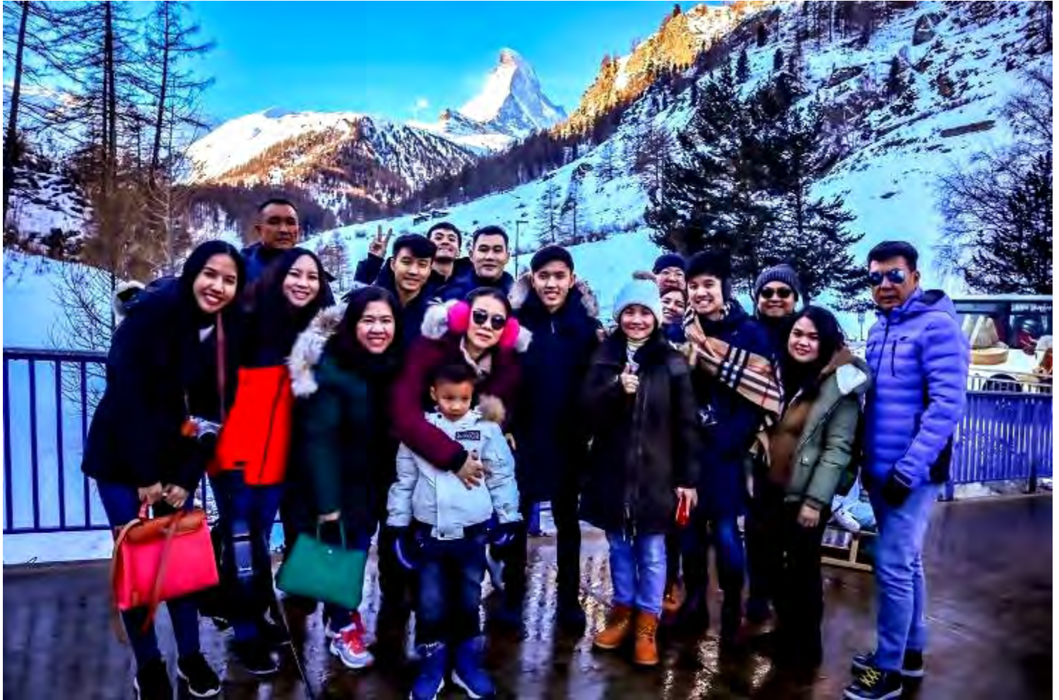
ยุโรปตะวันออก 9วัน TG DELUXE พัก Hallstatt เดินทางปีนํ 29ค.ค.-06ม.ค.2562(จํนวน28ทํน)