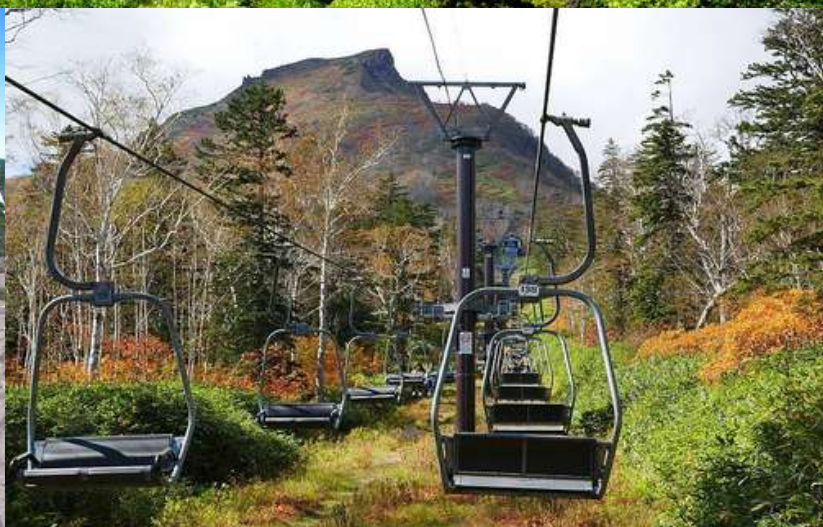
ภาพประกอบเพื่อการโฆษณาเท่านั้น