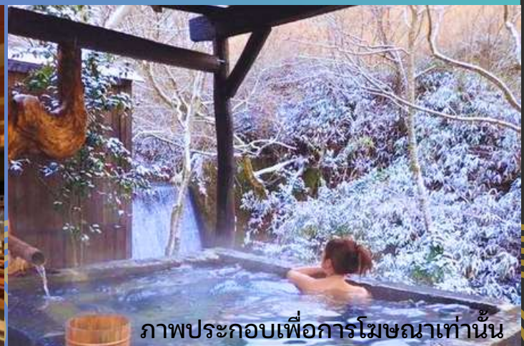
ภาพประกอบเพื่อการโฆษณาเท่านั้น