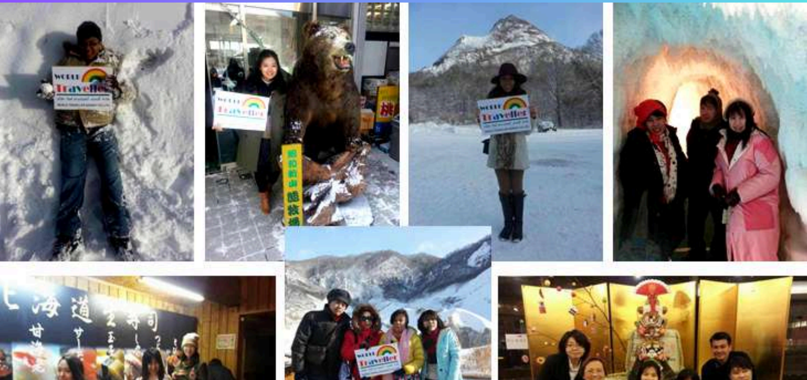
คณะท่องเที่ยว ฮอกไกโด-ซัปโปโร-โอตารุ-ICE PAVILLION 6 วัน TG