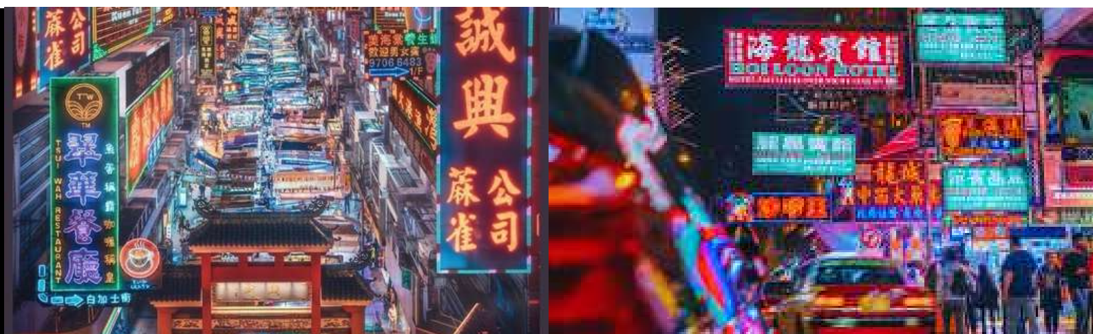
ย่านมงก๊ก