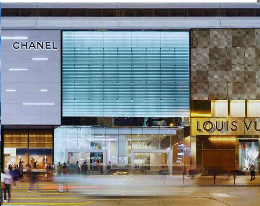
ห้างอาหารHarbour City แหล่งรวมทุกอย่าง...ย่านจิมซาจุ่ย