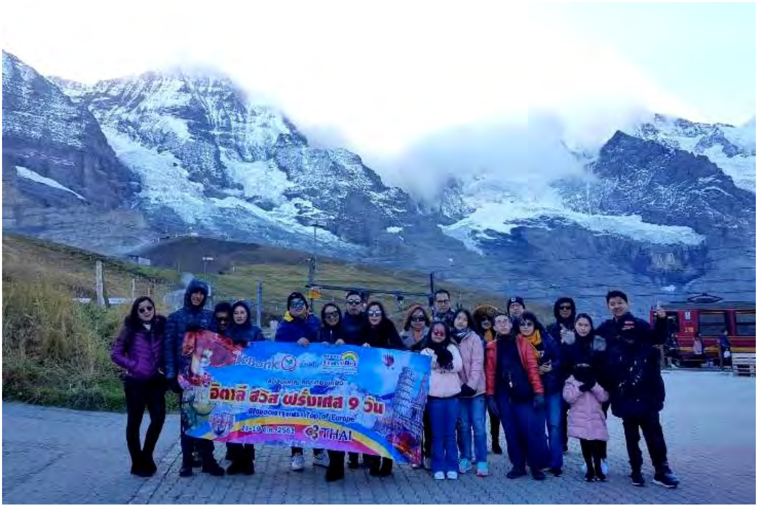
อิตาลี-สวิสเซอร์แลนด์-ฝรั่งเศส 9วัน TG PROMOTION4 เดินทางวันที่ 06-14 ต.ค.2561(จำนวน20ท่าน)