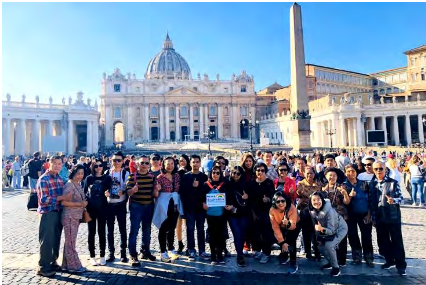
ไอร์แลนด์-สกอต 9วัน TG SUPERIOR วันที่ 23-31 ต.ค.2562 (จำนวน20ท่าน)