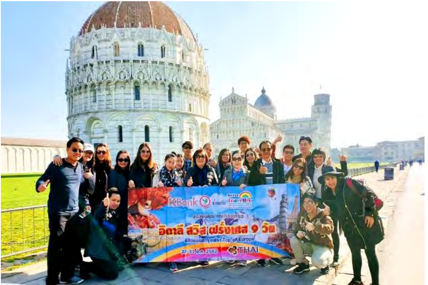
อิตาลี-สวิตเซอร์แลนด์-ฝรั่งเศส 9วัน TG PROMOTION4 วันที่23-31มี.ค.2562 (จำนวน24ท่าน) BUS2