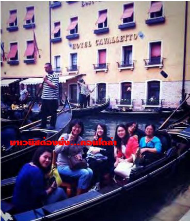
มาวีนิสต์ต่องนี้...คอนโดล่า