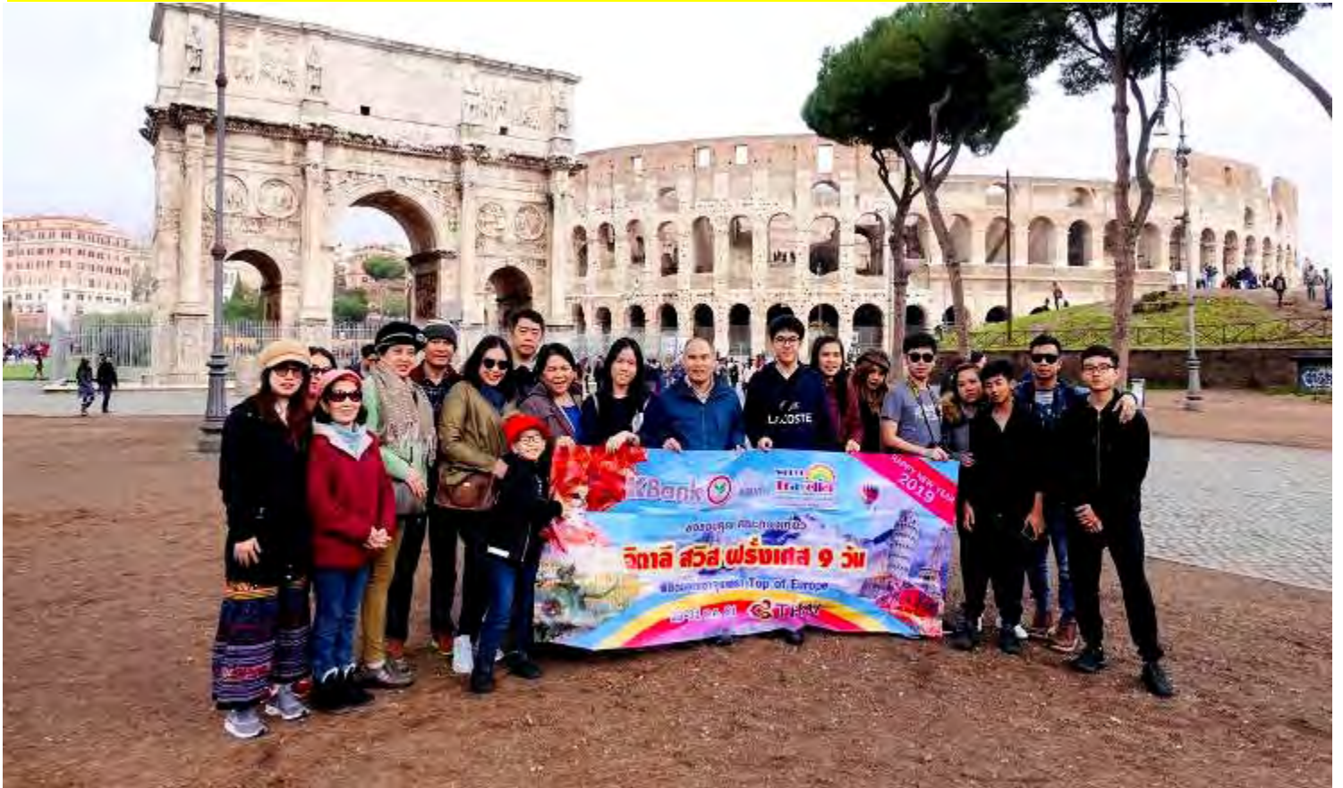
อิตาลี-สวิสเซอร์แลนด์-ฝรั่งเศส 10วัน TG DELUXE เดินทางปีใหม่ 22-31ธ.ค.2561(จำนวน20ท่าน)